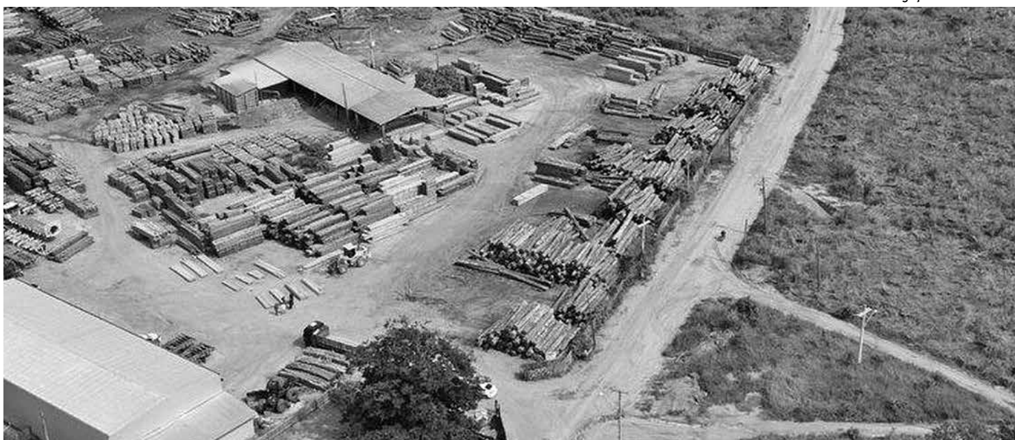
Ação teve início na última quinta-feira (11) e contou com a atuação da Polícia Federal, do Instituto do Meio Ambiente, Ibama e Funai