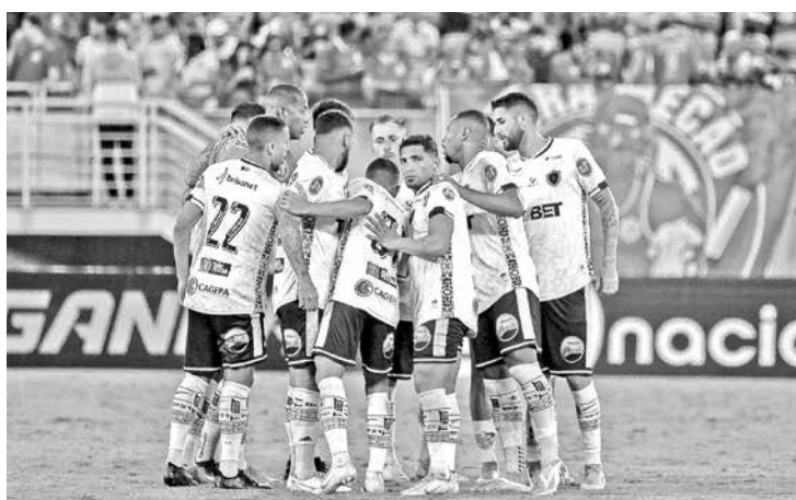
Após três jogos, o Botafogo conquistou sete pontos e está em 4º lugar