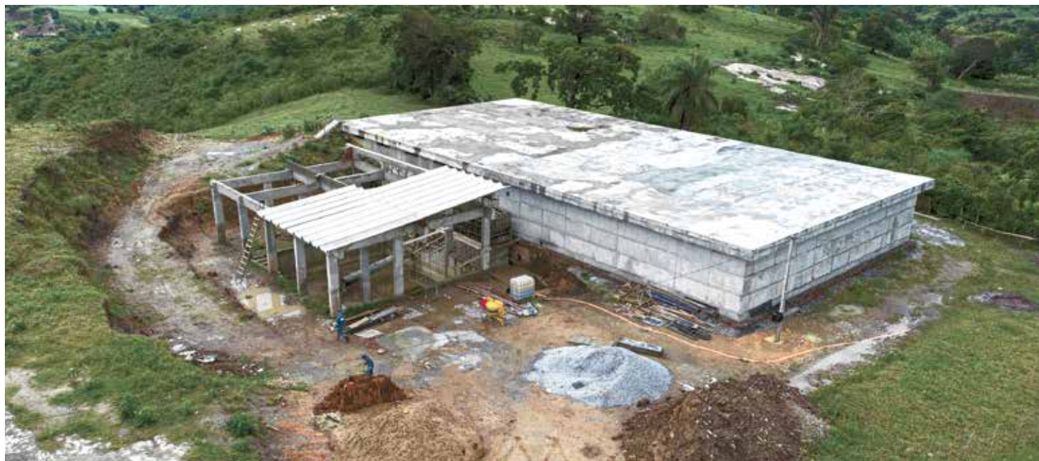
Adutora vai beneficiar diretamente 12 municípios do Brejo paraibano com o equacionamento do fornecimento d'água frente à estiagem