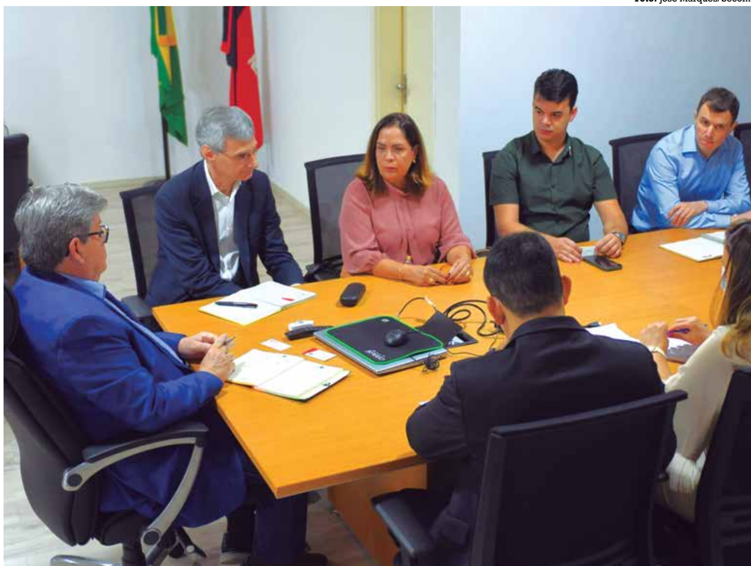
Governador João Azevêdo ressaltou, durante o encontro com representantes do BID, os avanços da saúde pública da Paraíba

“O projeto está em vias de lançar três grandes li-