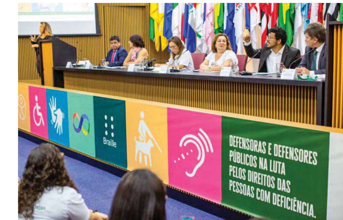
Campanha é uma iniciativa da Associação Nacional das Defensoras e Defensores Públicos e foi lançada em Brasília dia 4 de maio

"A Anadep lançou este ano a campanha 'Defensoria Pública: em ação pela inclusão' relacionada a inclusão das pessoas com deficiência. Isso significa que todas as Defensorias vão se empenhar em ações voltadas para esse público. Esse tema vai estar ainda mais na pauta das ações de todas as Defensorias no Brasil", explica a coordenadora do Núcleo Especial de Cidadania e de Direitos Humanos (NECIDH) da