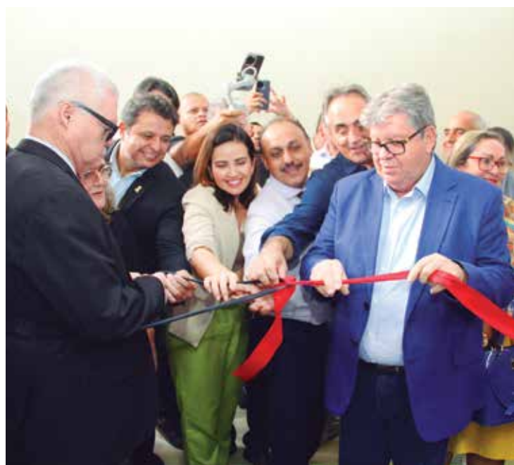
Governador João Azevêdo inaugurou o auditório que atende a todas as regras de acessibilidade, possibilitando aos deficientes visuais desenvolverem várias atividades

“Nossa relação com o Instituto vem desde o primeiro dia que nós chegamos ao Governo. Nós sabemos da importância do serviço que é prestado pelo Instituto dos Cegos. Uma história de 79 anos de assistência verdadeira a quem precisa. Eu tenho um prazer muito grande de estar aqui porque dois anos atrás eu estava aqui, no dia 17 de maio, inaugurando o ginásio, o que eu fico feliz porque as informações são de