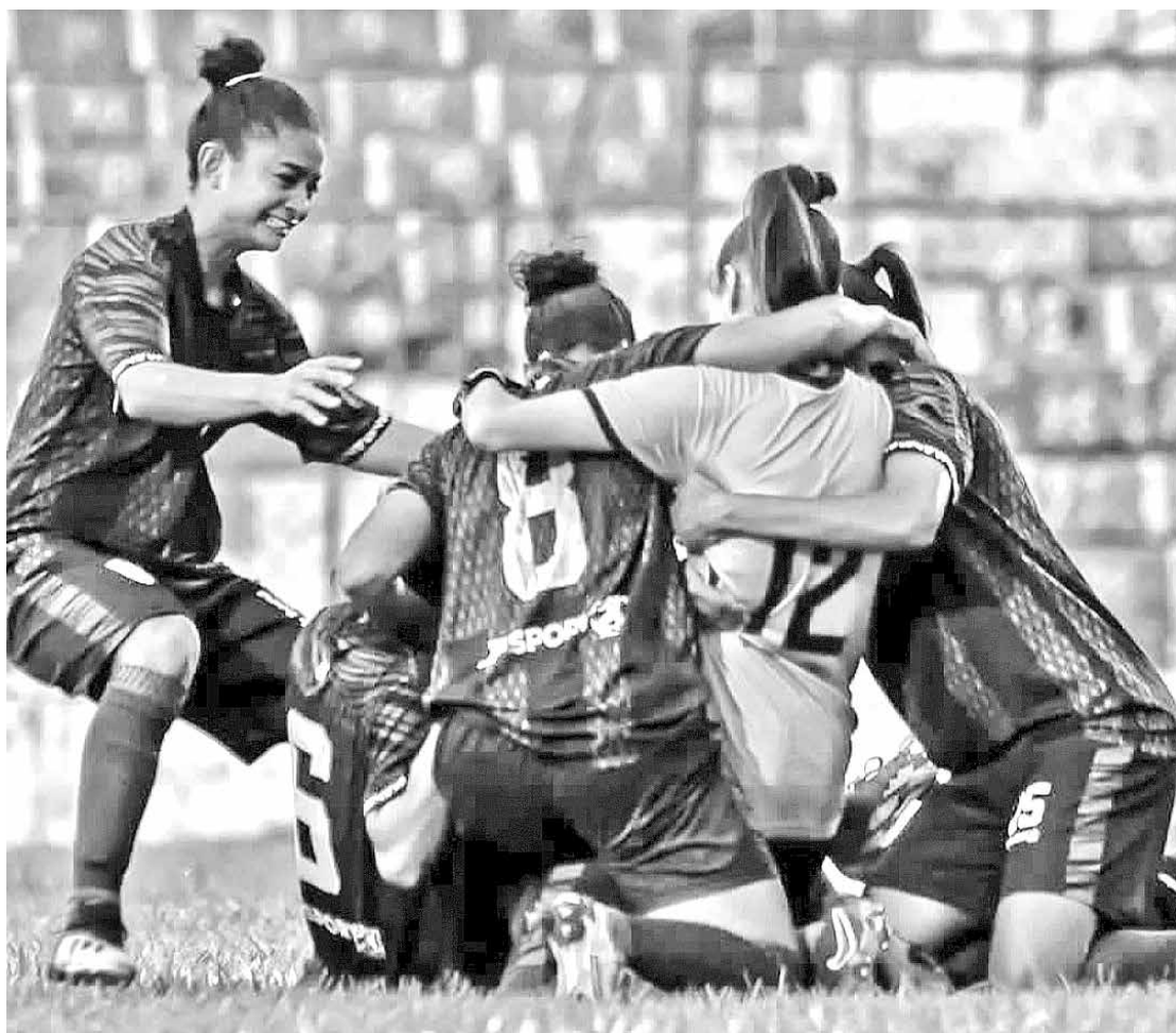
Jogadoras do VF4 comemoram a classificação às quartas de final do Brasileiro Feminino A3

Nas oitavas de final, as Panteras eliminaram o Guarani de Juazeiro-CE, nas cobranças de pênaltis na segunda partida disputada no último fim de semana, em Barbalha-CE. Com empates por 1 a 1, na primeira partida e 0 a 0, na segunda partida, com direito a dramaticidade, as paraibanas levaram a melhor nas disputas por pênaltis. Restando seis minutos para o fim da partida, o VF4 teve a goleira Gabi expulsa após tomar o segundo amarelo por reclamação. Sem goleira reserva, o treinador teve de improvisar a zagueira Ta-