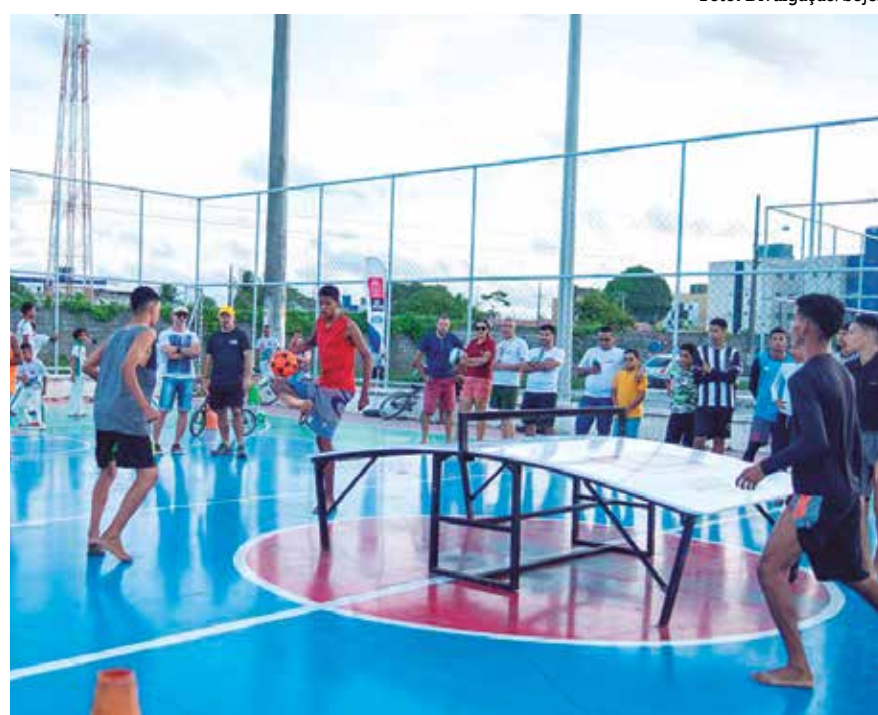
A disputa do Futmesa é uma mistura de tênis de mesa, futebol e futevôlei