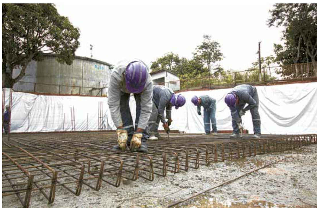
Sistema vai possibilitar abastecimento d'água potável por período de alcance de até 25 anos

Para 2024 está prevista a licitação da adutora, ligando Remígio a Algodão de Jandaíra, resolvendo em definitivo a situação de falta d'água no Brejo, que tem enfrentado problemas de estiagem. "A realização dessas obras efetua o compromisso de campanha do governador João Azevêdo, que é dotar de segurança hídrica as cidades do Estado da Paraíba", ressaltou Deusdete Queiroga.