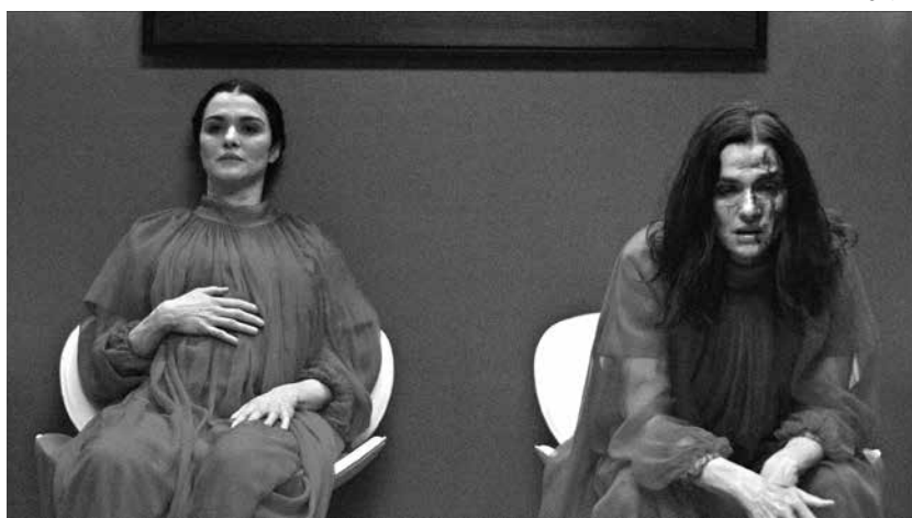
'Gêmeos - Móbida Semelhança', série protagonizada duplamente por Weisz

As roteiristas e produtoras Miriam Battye e Alice Birch, que trabalham juntas na favorita da crítica Succession , são os principais nomes por trás da versão para streaming . Lançada como minissérie espalhada ao longo de seis episódios, Gê-