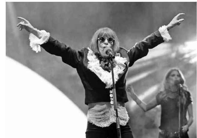
Rita Lee durante um show no ano de 2013, em São Paulo