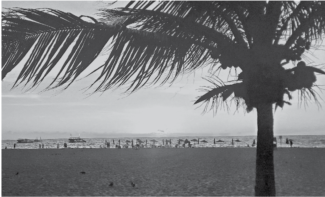
Dia em nascimento