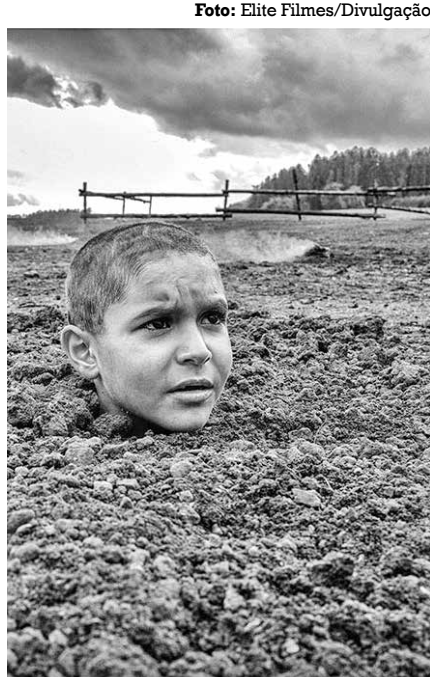
Garoto judeu se vê diante de mundo hostil